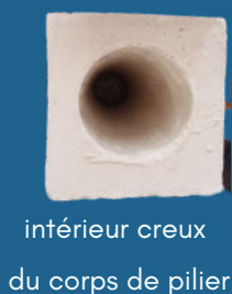
intérieur creux du corps de pilier