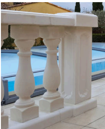
hauteur totale 85cm

Finition : Lisse au touché - paraît brillante neuve et se matifie avec le temps